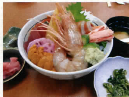
海鮮丼 1,200円 (税込1,260円)