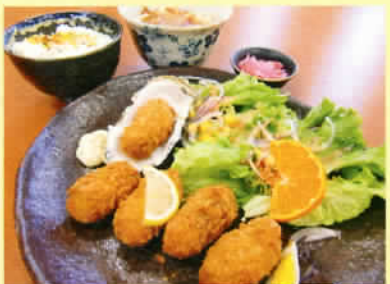
カキフライ定食 ライス 小うどん付