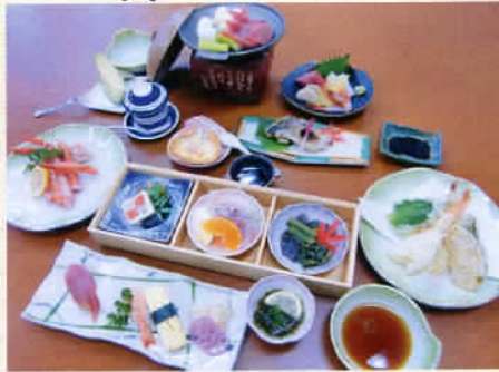
※季節により料理内容の変更があります