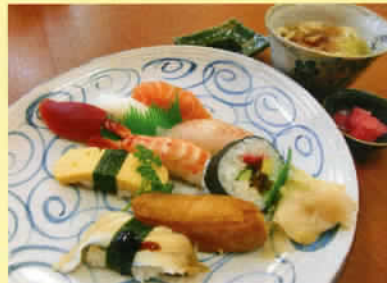
にぎり寿司盛合せ 小うどん付