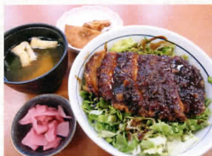
ソースカツ丼 850円 (税込892円)