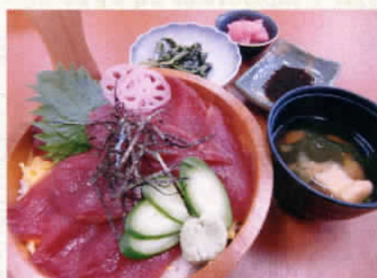
敷島名物てこね寿司 680円 (税込714円)