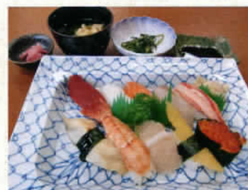
上にぎり寿司 950円 (税込997円)