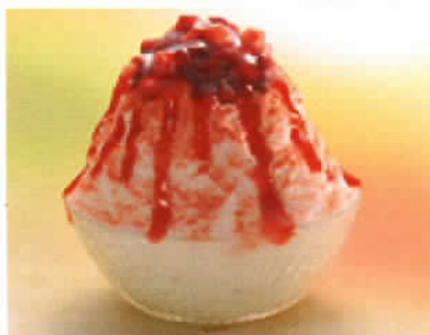
天使の雪 (いちご) 税込み500円