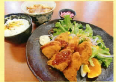
白身魚定食 ライス 小うどん付