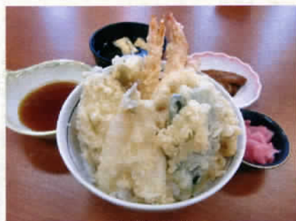
メガ天井 1,000円 (税込1,050円)