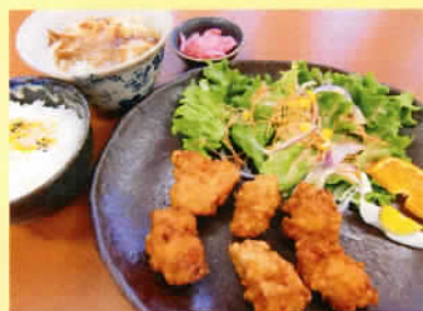
唐揚げ定食 ライス 小うどん付