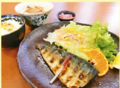
焼魚(サンマまたはサバ)定食 ライス 小うどん付 ※生から焼き上げるため、少々お時間いただきます。