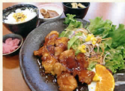
照焼チキンステーキ定食