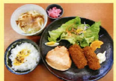
カニクリームコロッケ定食 ライス 小うどん付