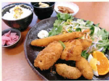
フライ盛り合わせ定食