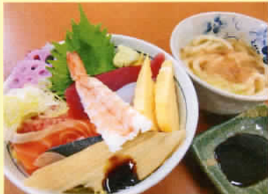
ちらし寿司 小うどん付