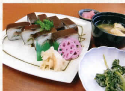
敷島風さば松前 1,000円 (税込1,050円)