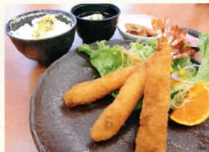
メガえびフライ定食