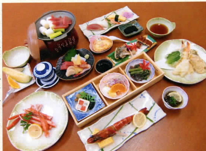
※季節により料理内容の変更があります