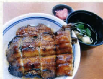
敷島うなぎ丼 1,800円 (税込1,890円)