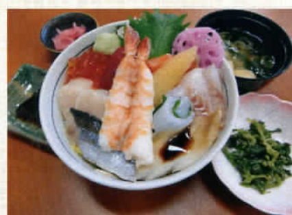
生ちらし寿司 950円 (税込997円)