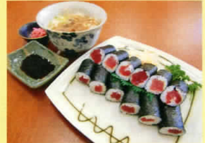
鉄火巻 小うどん付