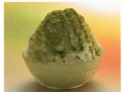
天使の雪 (抹茶) 税込500円