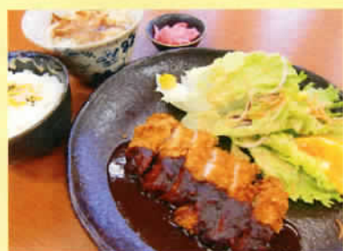
味噌カツ定食 ライス 小うどん付