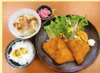
アジフライ定食 ライス 小うどん付