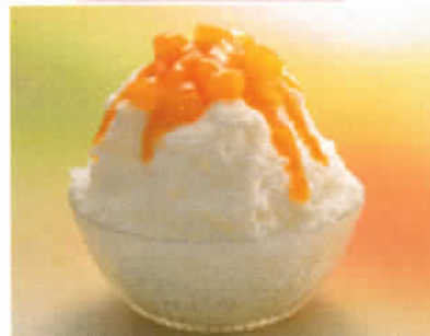
天使の雪 (マンゴー) 税込500円