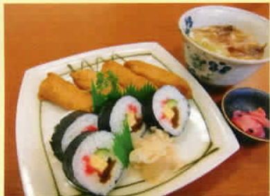
助六寿司 小うどん付