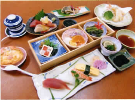
※季節により料理内容の変更があります