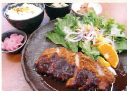
やわらか味噌豚カツ定食