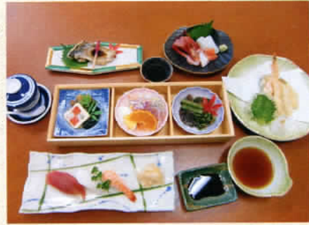
※季節により料理内容の変更があります